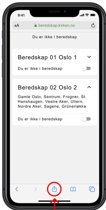
Klikk på delingsknappen i Safari-menyen