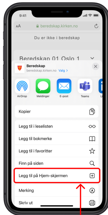
Bla ned og velg "Legg til på Hjem-skjermen"