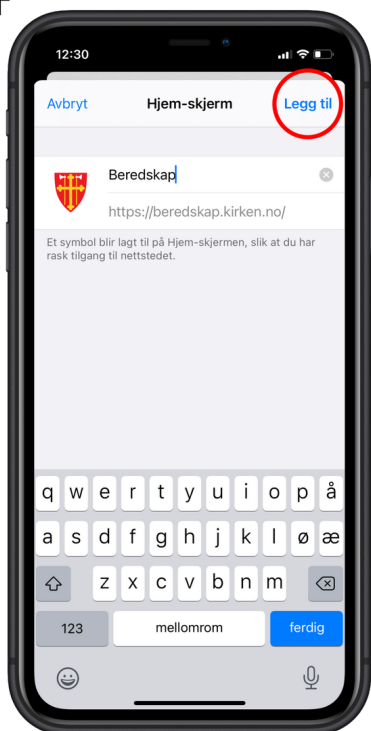
2. Klikk på "Legg til"