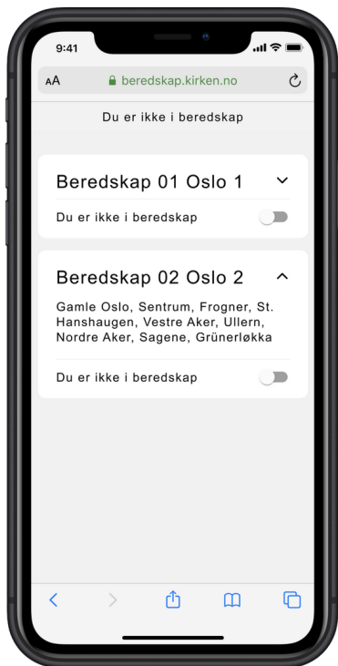
Åpne og logg inn på nettsiden: beredskap.kirken.no