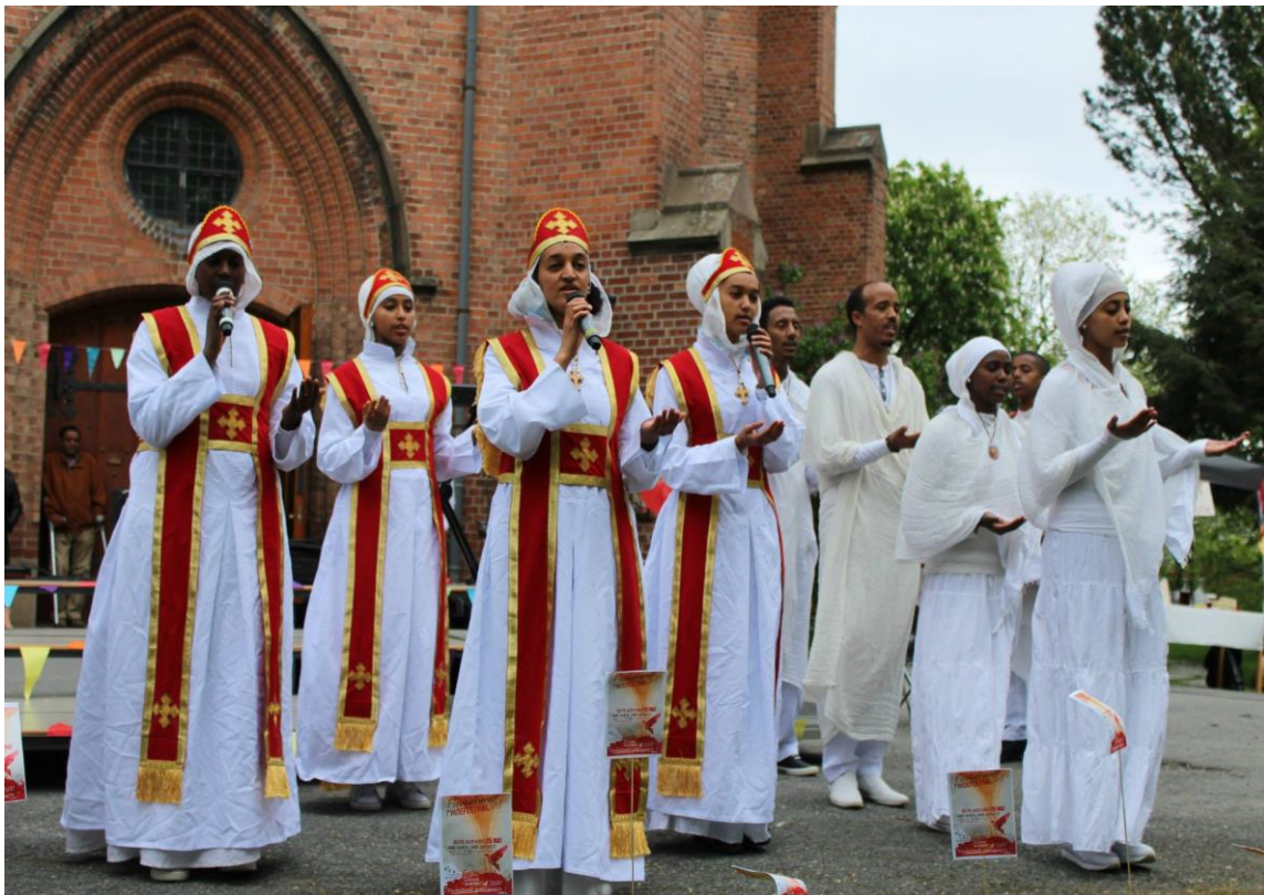
Eritreisk ortodokskor framfører liturgisk musikk på Pinsefestival 2015 ved Østre Aker kirke.

Etiopiere og eritreere i Norge inngår også i protestantiske menigheter i Oslo og andre steder i landet. Selv om oppstarten strekker seg tilbake til 1985, ble den første protestantiske menigheten først dannet i Oslo i 1994. 29 Akkurat som for de ortodokse, rekrutterer de protestantiske menighetene blant etiopiere og eritreere i hele landet. På protestantisk hold finnes det menigheter av både språklige (oromo, amharisk, tigringna) og konfesjonelle varianter (pinsevenner, adventister og lutheranere). I tillegg tilbys det romersk-katolsk sjelesorg, som er basert i Oslo men betjener eritreiske katolikker i hele landet.