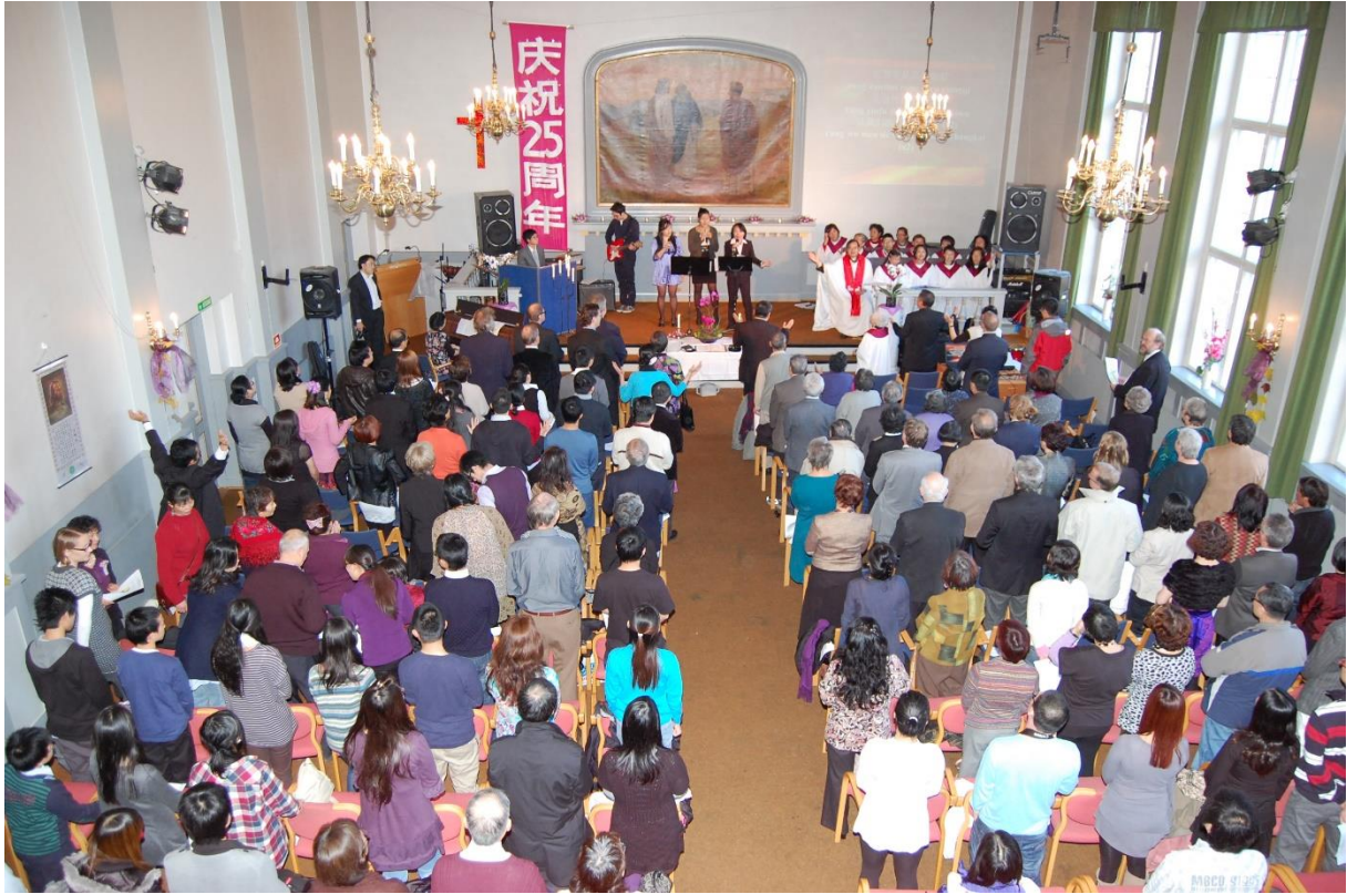
25års jubileet av den kinesiske menigheten i Oslo